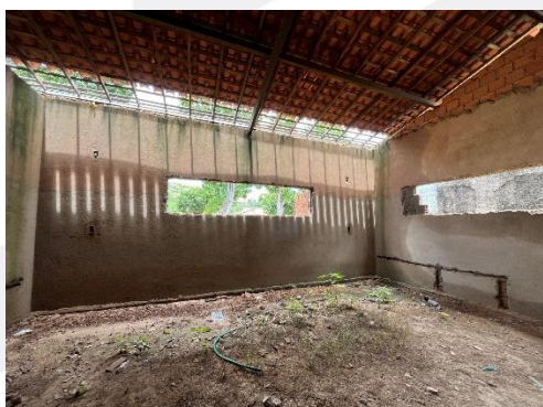
Imagem 04 a 07 – Ampliação objeto de rescisão.

Av. Pedro Freitas, S/N Centro Administrativo • Bloco D/F São Pedro • CEP 64018-900 Teresina • Piauí • Brasil