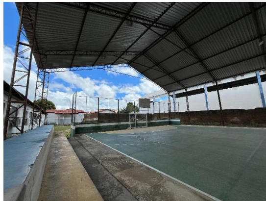
Imagem 08 e 09 – Quadra poliesportiva existente.