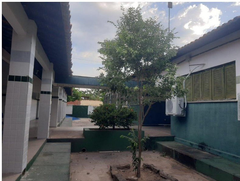
Imagem 12 a 14 – Biblioteca e Circulação entre blocos.