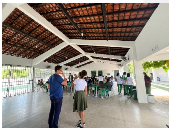
Imagem 02 e 03 – Fachada frontal e pátio central.