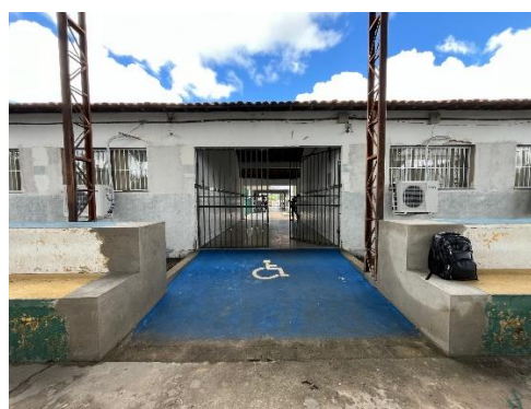
Imagem 10 e 11 – Vistas gerais.